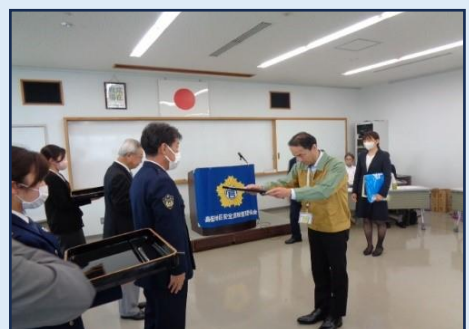
中部電力(株)静岡水力センター