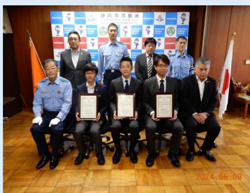
静岡マツダ(株) （左） 静岡済生会総合病院 （中央） 三菱電機(株)静岡製作所 （右）