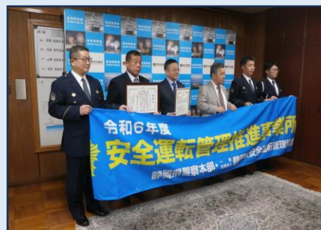
【相川専務の推進宣言】