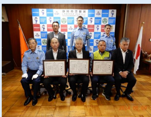
静岡トヨタ自動車(株) （左） 静岡市農業協同組合本店 （中央） 東光ガード(株) （右）