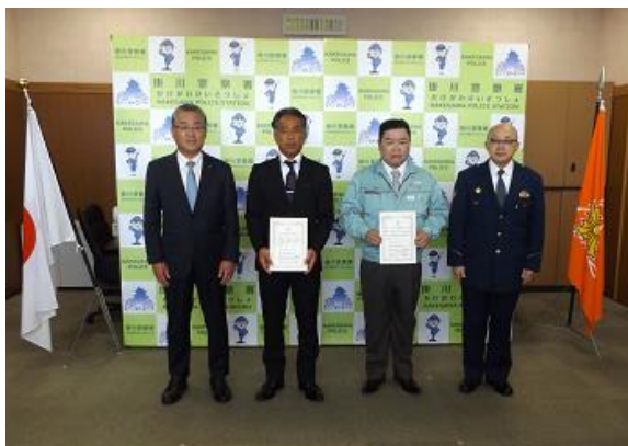
中央 左から 「掛川市南消防署」、「(株)榛葉鉄工所本社工場」

引き続き、引継式を実施し、前年度の安全運転管理推進事業所の「(株)尾崎工務店」、「中遠ガス(株)」から令和4年度に推進した活動や事業所の取り組みなどについて説明がありました。