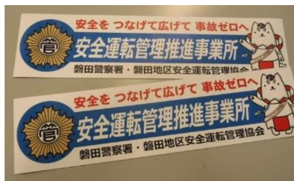
「推進事業所マグネットステッカー」