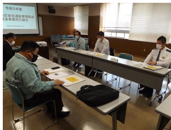
前年度推進事業者からの説明