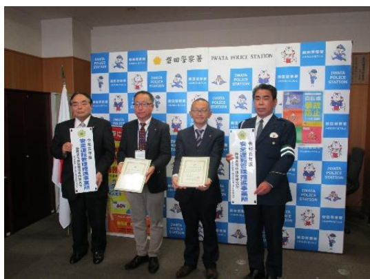
中央2人 静岡県農林技術研究所(右) 静岡県立農林環境専門職大学(左)

本年度の安全運転管理推進事業所に指定された「静岡県農林技術研究所」、「静岡県立農林環境専門職大学」に対して、署長から指定証が交付され、磐田地区安全運転管理協会会長からは、「推進事業所プレート」「推進事業所マグネットステッカー」「ドライブレコーダー」が贈呈されました。