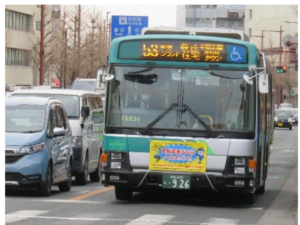
【遠州鉄道路線バスの広報幕】