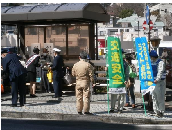
【安管協会役員とともに交通安全広報】