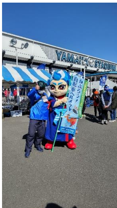
【試合前イベントの様子】