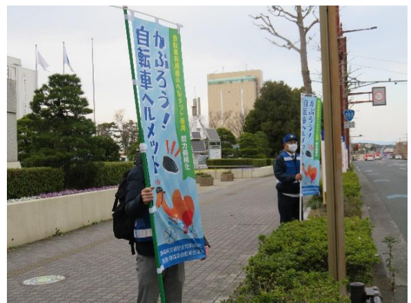
【のぼり旗による街頭広報】