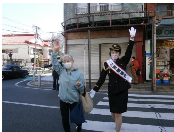
【高齢歩行者の道路横断指導】