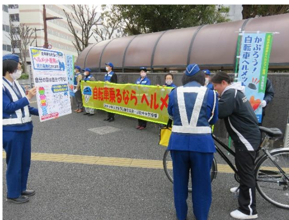
【自転車利用者に対する広報活動】