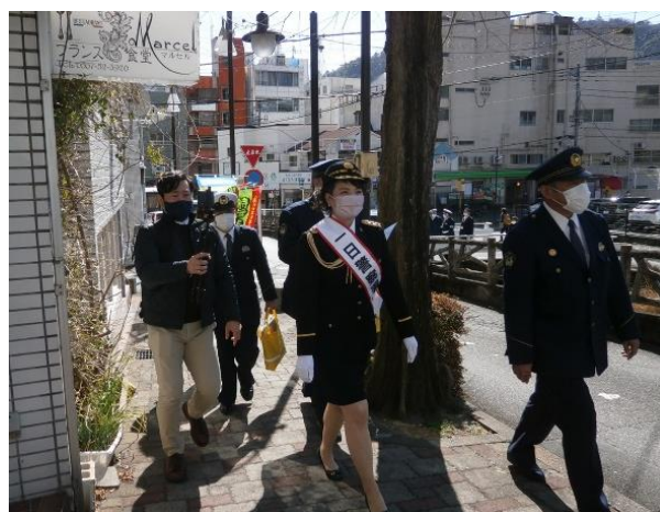
【熱海市内をパトロール】