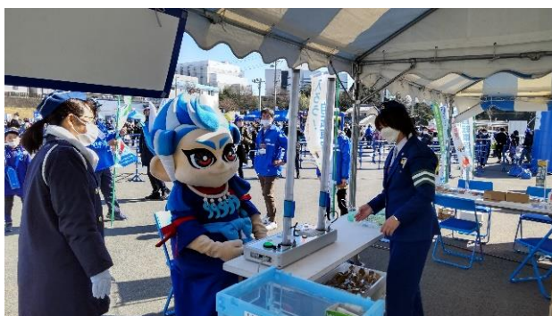
【クイックキャッチによる交通安全教室】

活動内容：ジャパンラグビーリーグワンの試合前イベントに合わせ、観戦客に対しクイックキャッチによる体験型交通安全教室を実施したほか、交通安全啓発品を配布しながら、交通事故防止と自転車ヘルメットの着用促進を呼び掛ける交通安全広報を実施しました。