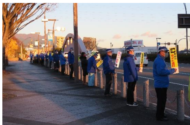
【「ライト点灯」のハンドプレート掲出して街頭広報活動】