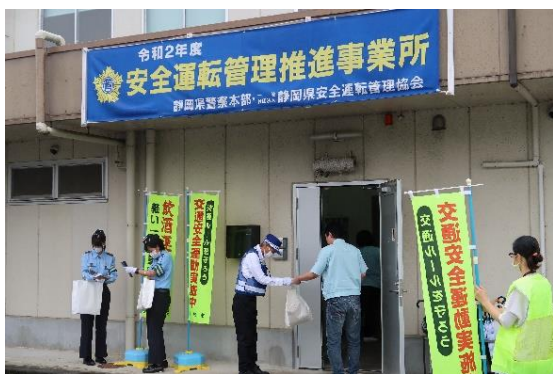
交通安全運動の広報活動

内容：細江警察署、安協細江地区支部とともに、出勤する同社従業員に対し交通安全運動の広報活動を実施した他、運転適性検査（CRT）やクイックキャッチを使用した体験会を開催しました。 コロナウイルス感染防止対策のため、短時間での体験会となりましたが、参加者一人ひとりが真剣に取り組んでいました。