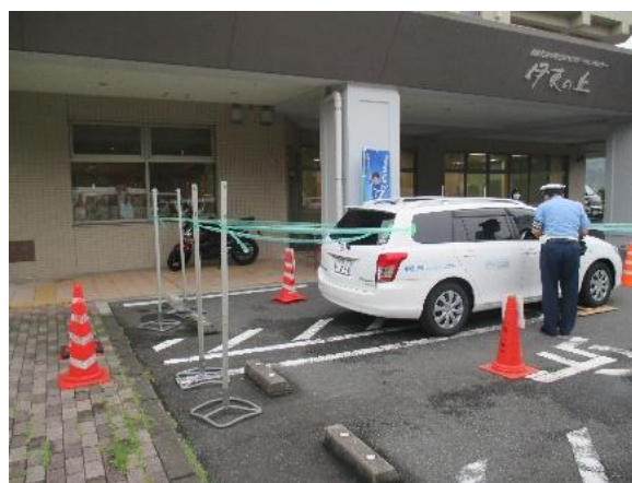
乗用車の死角を確認する体験教室（警察署交通課員が説明）