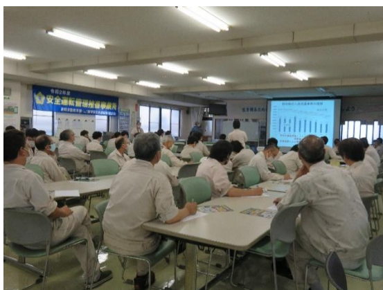
交通課員による交通安全講習

内容：浜松中央警察署交通課員により、交通事故防止や道路交通法改正（あおり運転等）の解説など、交通安全講習を実施しました。 コロナウイルス感染防止対策で受講者を少人数とし、当日の講習をビデオ録画して、後日残り従業員のビデオ講習を実施しました。