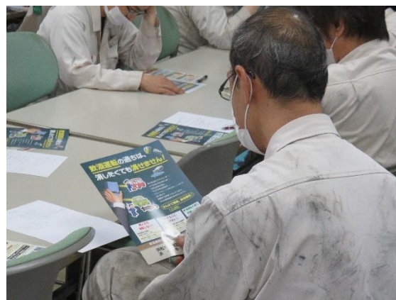
飲酒運転根絶チラシを見る講習参加者