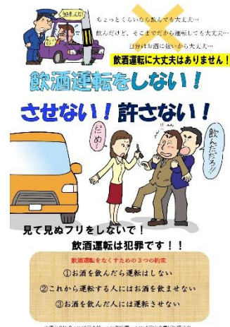
【飲酒運転根絶ポスター】