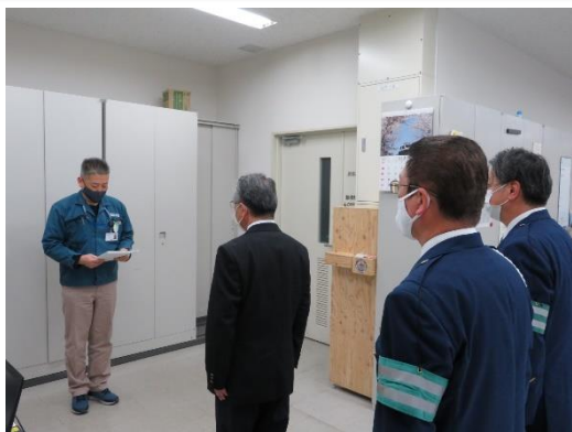
【交通安全誓約書読み上げ】

新型コロナウイルス感染症の影響で外出の機会が減少すると思われるものの、大型連休中には近場への車利用のケースが多くなると予想されるため、交通事故防止への効果が期待されます。