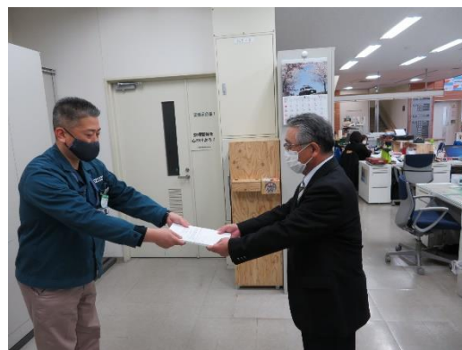
【交通安全誓約書を大野事務局へ提出】