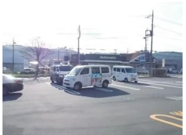
街頭巡回広報出発状況