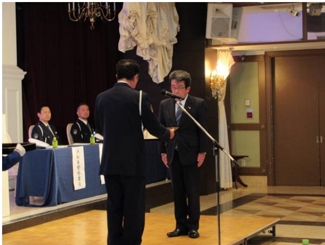
関東管区警察局長・関東安全運転管理者協議会連合会長の連名表彰伝達