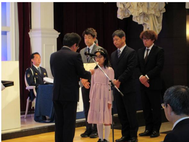
交通安全標語コンクール優秀作品表彰