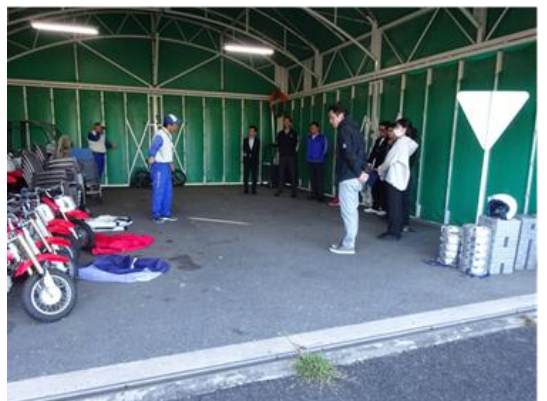
夜間視認性の状況