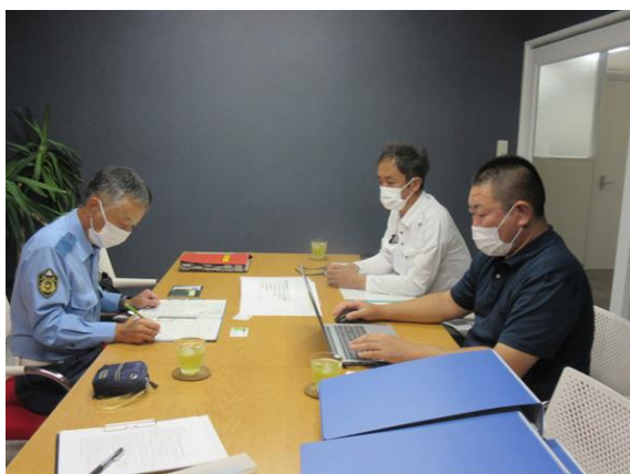
(警察官による指導状況)