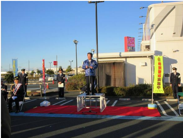
浜松東地区安全運転管理協会会長挨拶