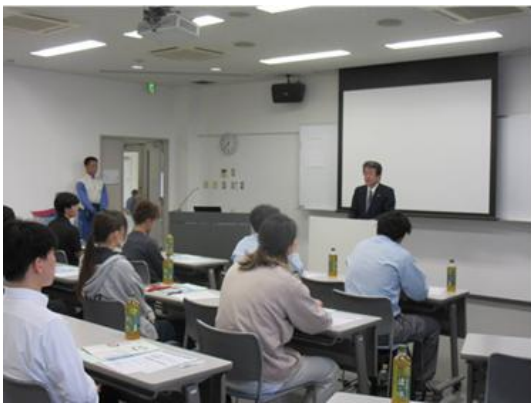
浜松東地区会長あいさつ