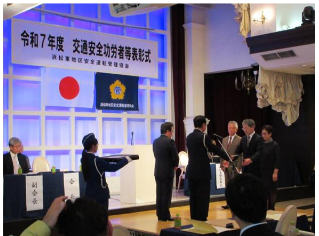
浜松東警察署長・浜松東地区安全運転管理協会会長連名表彰