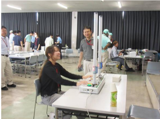
クイックキャッチ