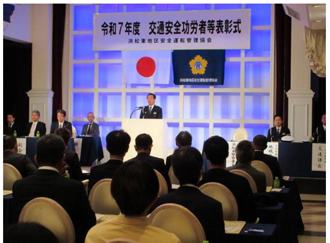
浜松東警察署長あいさつ