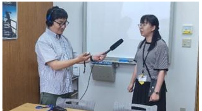
ヤマハモーターエンジニアリング（株）