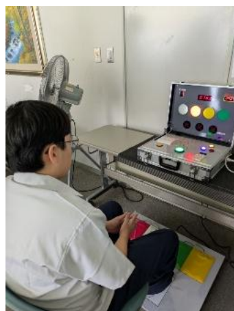
クイックステップ