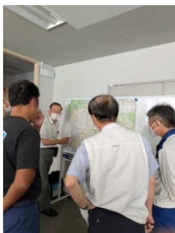
交通事故発生マップ