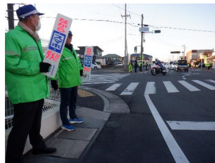
遠鉄ストア池田店前交差における広報活動