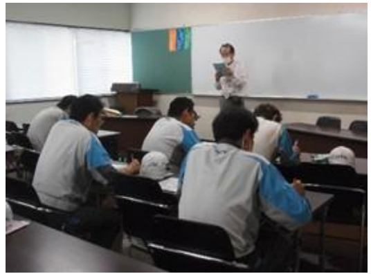
運転適性検査(K-2)実施の様子