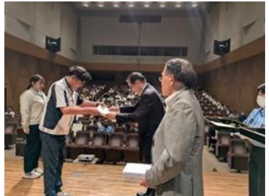
表彰状授与の様子