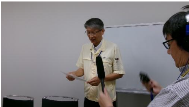
浜松ホトニクス（株）豊岡製作所