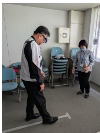
飲酒体験ゴーグル