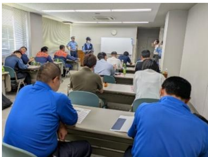
ヒューマンエラー 自己診断チェック