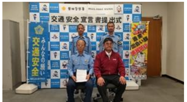
宣言書提出の様子