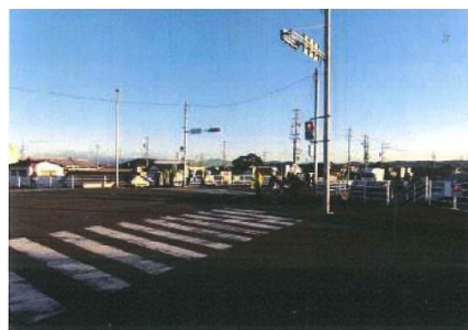
豊浜橋東側交差点における広報活動