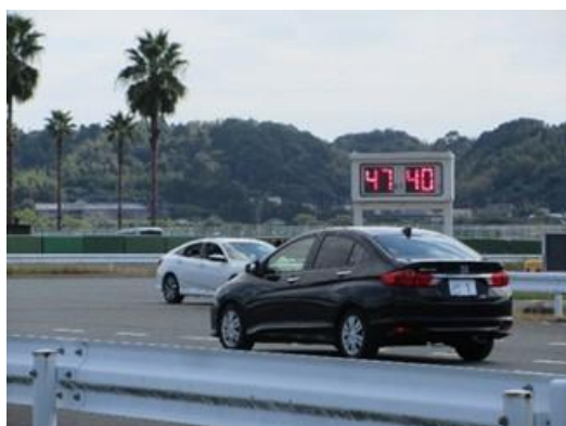
【47km走行 危険察知から40mで停止】