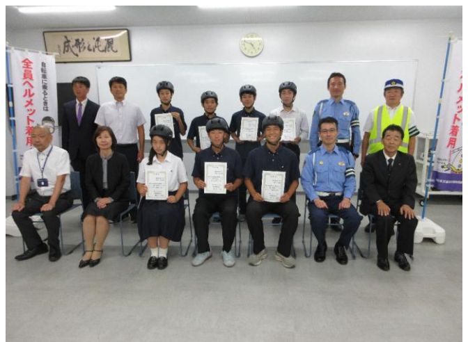
任命書、ヘルメットの交付