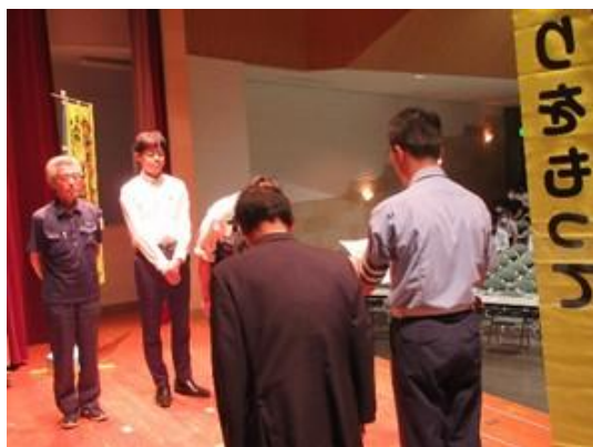
宣言書を受領する署長、藁科会長