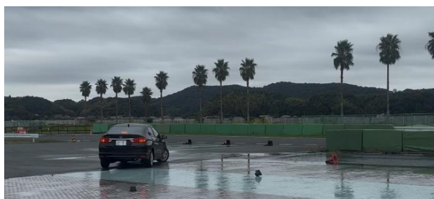
【低μ路 急ブレーキ後のハンドル操作】