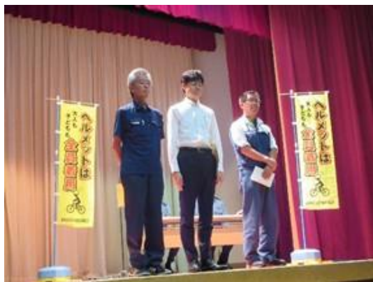
宣言書提出 3事業所の紹介