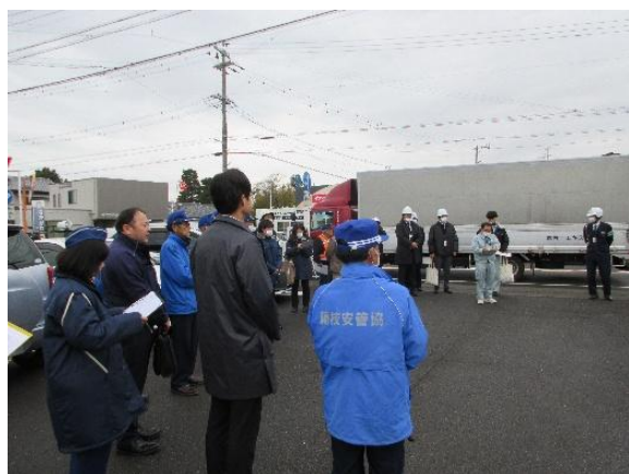
【現場診断・藁科会長、推進事業所】