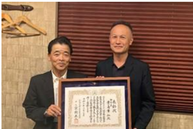
藁科会長、青島副会長