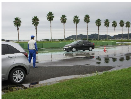
【車の危険性体験 滑りやすい路面】