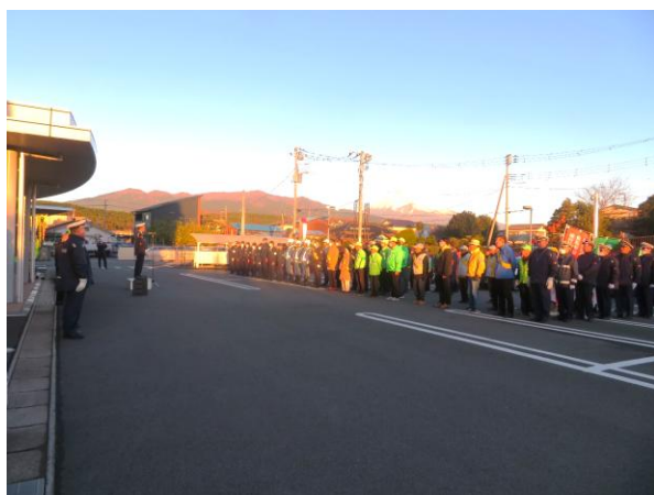
裾野警察署で開始式の様子

概要 裾野地区安全運転管理協会 は、裾野警察署で行われた年末の交通安全県民運動の出陣式に、 役員・事務局長 が参加し、周辺道路でのぼり旗を持ち、広報活動を実施しました。 長泉町は、長泉町役場駐車場、ウエルディ長泉駐車場、すき家駐車場の3か所で開始式を行い、 会長・役員・安全運転管理者・事業所の担当者 が近隣開催場所に参加し各付近の交差点で通勤の車、通学の児童・生徒に対して街頭啓発を行いました。