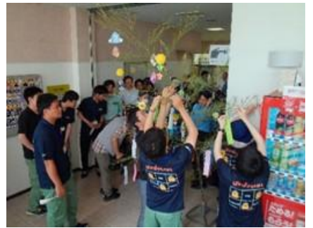
交通安全を祈念して書いた短冊を園児が飾り付けしました。