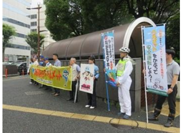
横断幕、のぼり旗を掲出し、交通事故防止や自転車利用者にヘルメット着用を呼び掛けました。