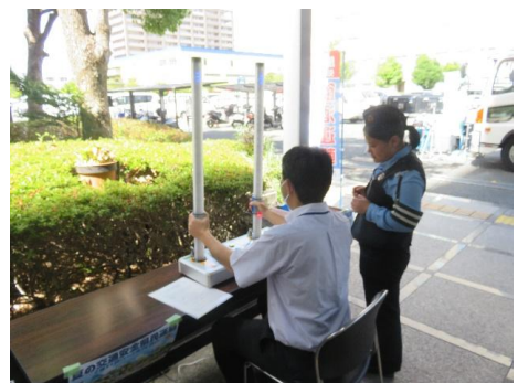
クイックキャッチ