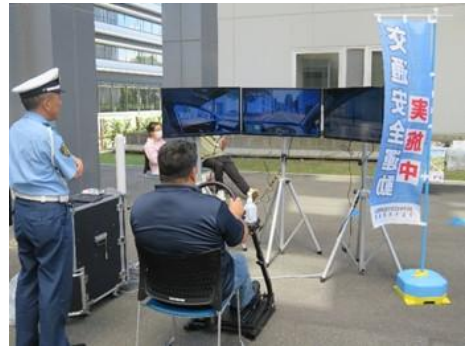
移動型シミュレーター