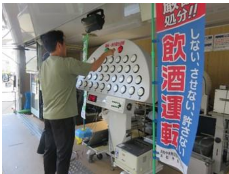
点灯くん(タッチくん)