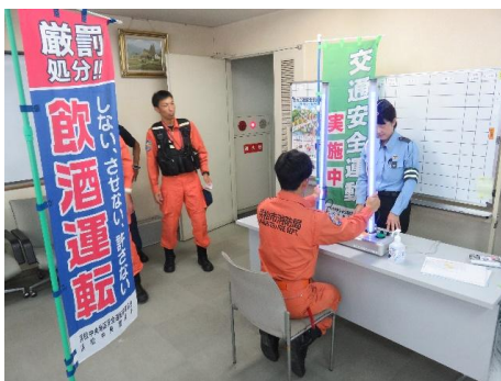
クイックキャッチ