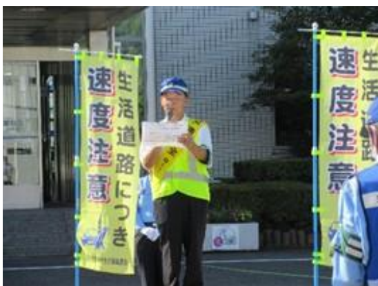
交通安全宣言(藁科会長)