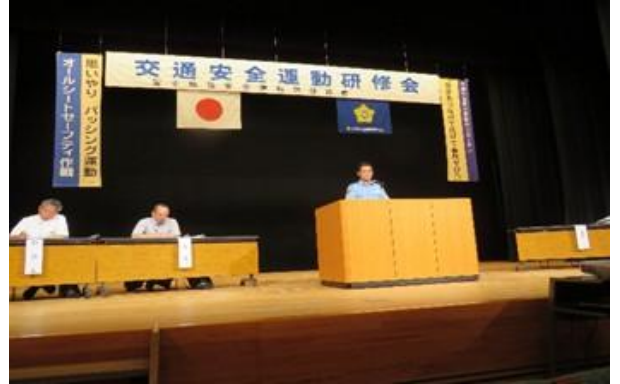
富士署交通課員による交通安全講和