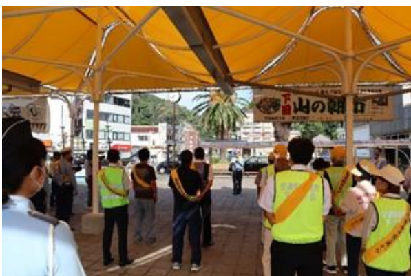
伊豆急下田駅前における活動