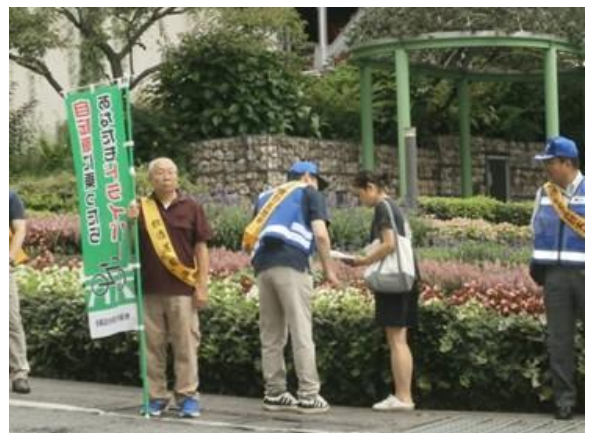
のぼり旗の掲出と街頭広報