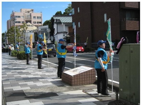
のぼり旗を掲げての街頭広報