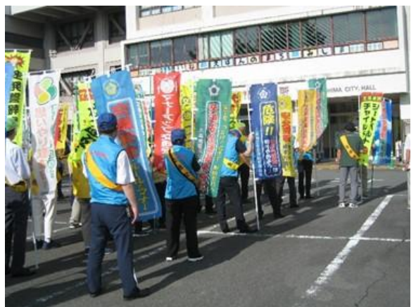
三島地区安管の参加役員