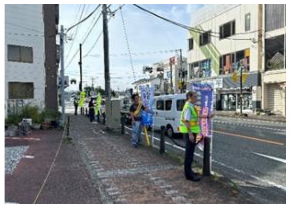
主要幹線道路における広報活動