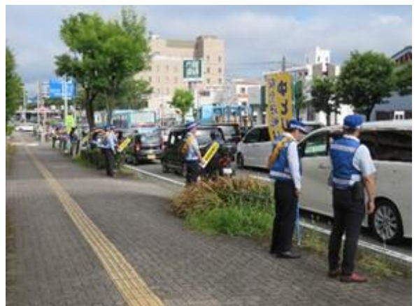
安管街頭活動状況