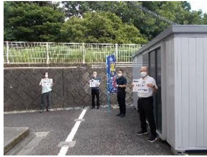
介護老人保健施設ラ・サンテふよう