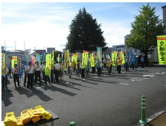
三島市役所での参加団体