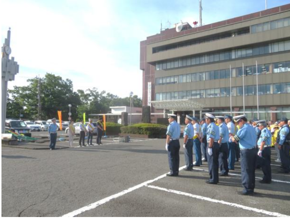
裾野市役所駐車場で開始式