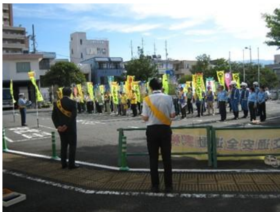
三島市役所での街頭広報初め式