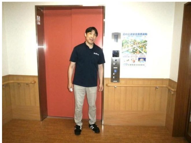
あたみ翔裕館1階エレベーターに掲示