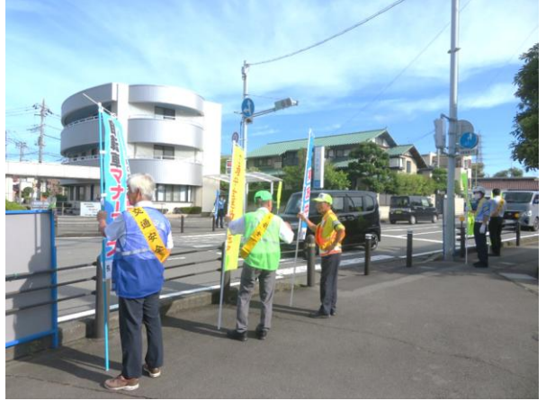
街頭啓発の様子 (左から白砂会長、大野事務局長)