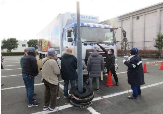
【トラック死角体験】