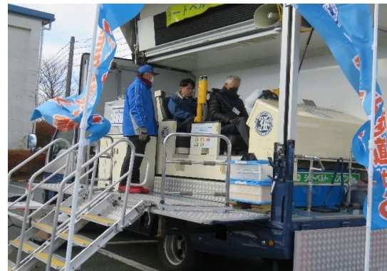
【シートベルト体験車】