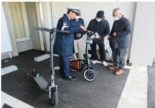
【電動キックボード】