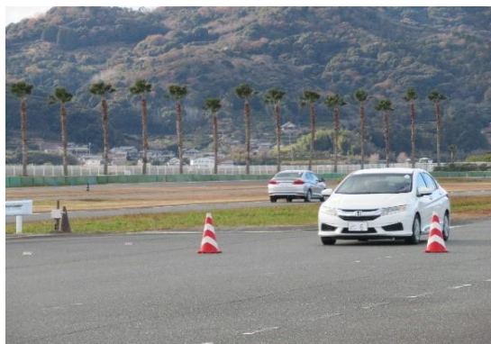
【停止距離の確認と体験】