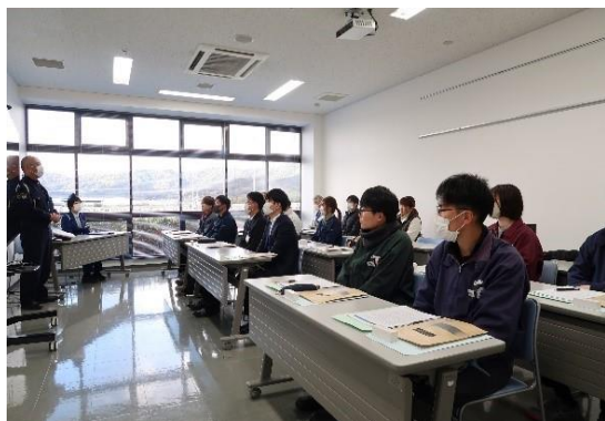
【警察官による講話】