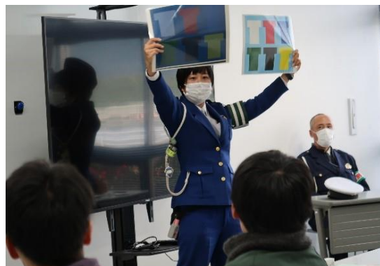
【薄暮時の色の見え方】