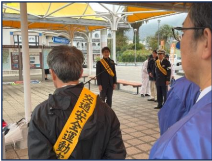
【下田市長あいさつ】