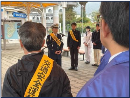
【下田署長あいさつ】