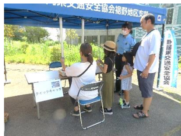
【反射材マスコット（ガチャ）】