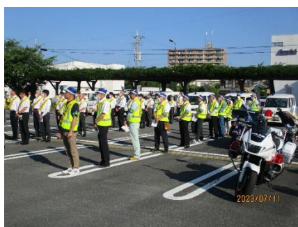
【街頭広報初め式の状況】