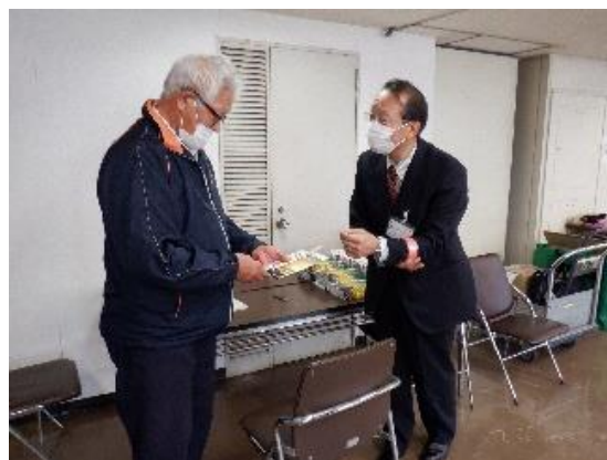
【「贖いの日々」を配付して 交通事故防止を呼び掛け】