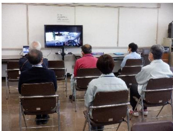
【交通安全教育用DVDの視聴】

等の体験型交通安全機器を使用した交通安全講習 など実施したほか、東京都交通安全協会発行の冊子「贖いの日々」を 参加者に配布して交通事故防止を呼び掛けました。