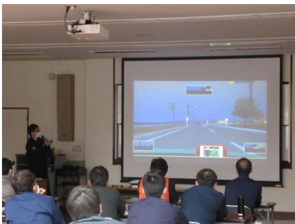
【危険予知トレーニング（KYT）】