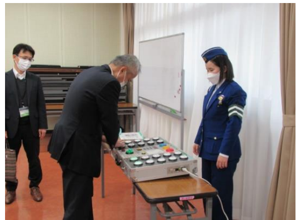
【交通安全機器・クイックアーム】