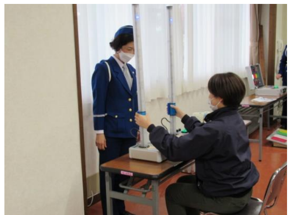
【交通安全機器・クイックキャッチ】