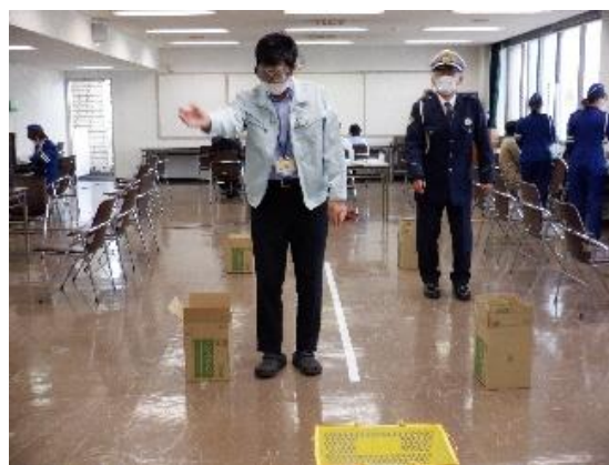
【酒酔い体験ゴーグルによる歩行体験】