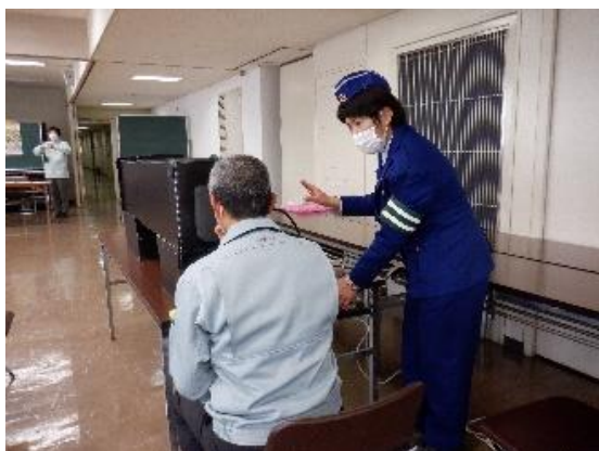
【グレアボックス体験 （反射材の効果等を確認）】