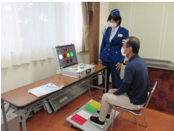
【交通安全機器・クイックステップ】