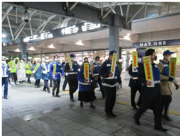
【繁華街をパトロールする参加者】