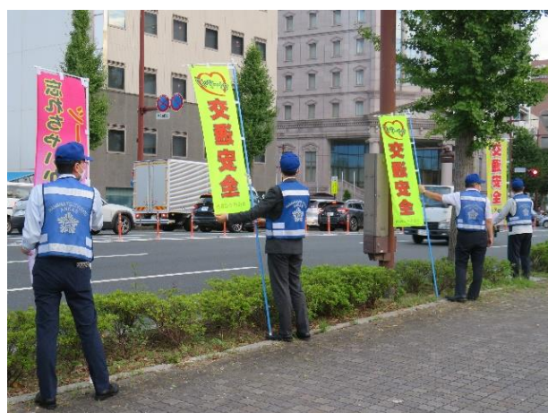
【浜松市役所前交差点において夕暮れ時の交通事故防止を呼び掛け】