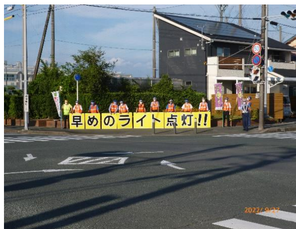
【通行車両や通行人に対して夕暮れ時の交通事故防止を呼び掛け】