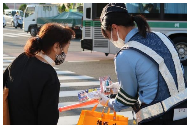
【通行人や自転車利用者に対して夕暮れ時の交通事故防止を呼び掛け】