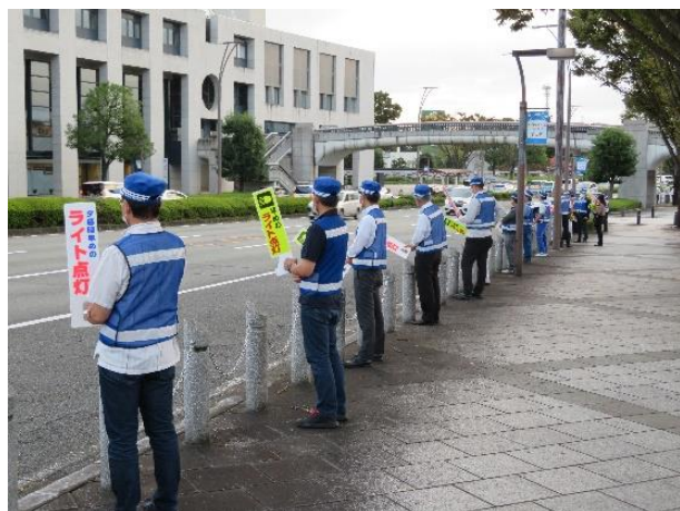
【「トライライト無事故作戦」でドライバーや歩行者に対し交通事故防止を呼び掛け】