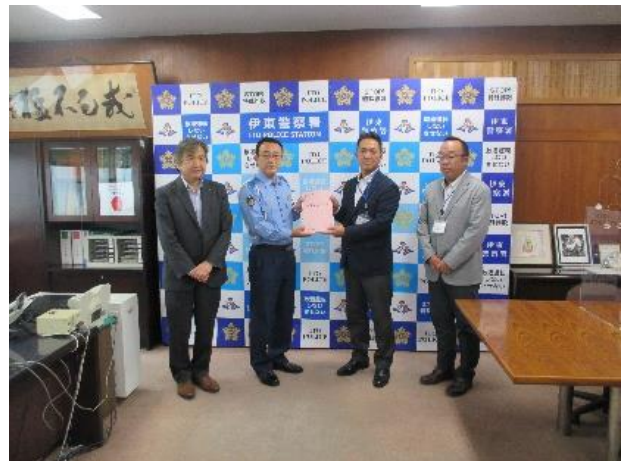
【伊東警察署において三坂署長へ交通安全宣言書を提出】