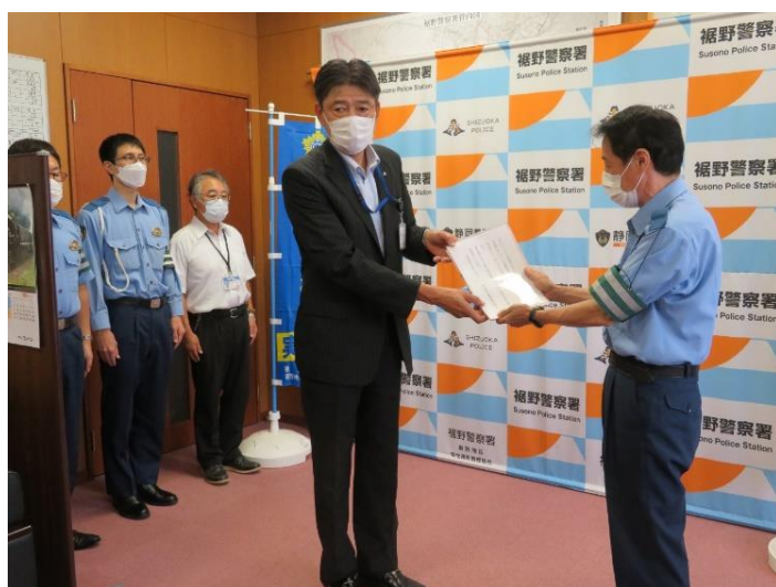
【山下・裾野警察署長へ交通安全宣言書を提出】