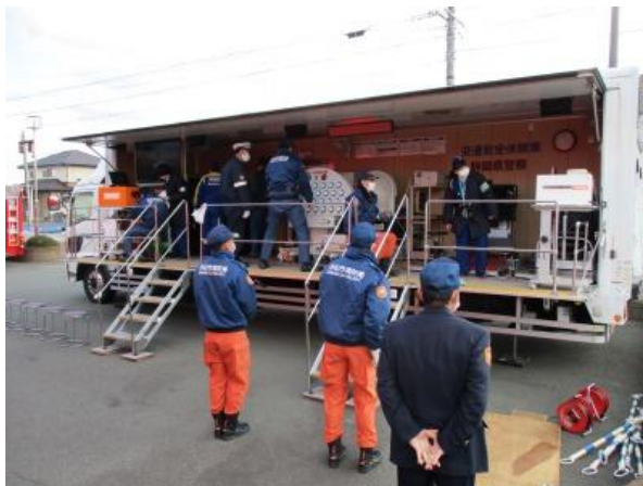
【交通安全教室参加者の様子】

活動内容：県警の交通安全体験車を使用して、ドライビングシミュレーター、点灯くん（運転・歩行能力診断）、夜間視認性体験装置等の交通安全機器を体験する交通安全教室を実施したもので、参加した消防職員から「自分の運転技術や注意点が分かった」「今後の安全運転に対する意識付けができた」等の感想が聞かれました。