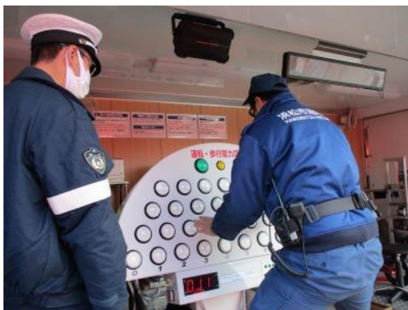
【点灯くん（運転・歩行能力診断）】