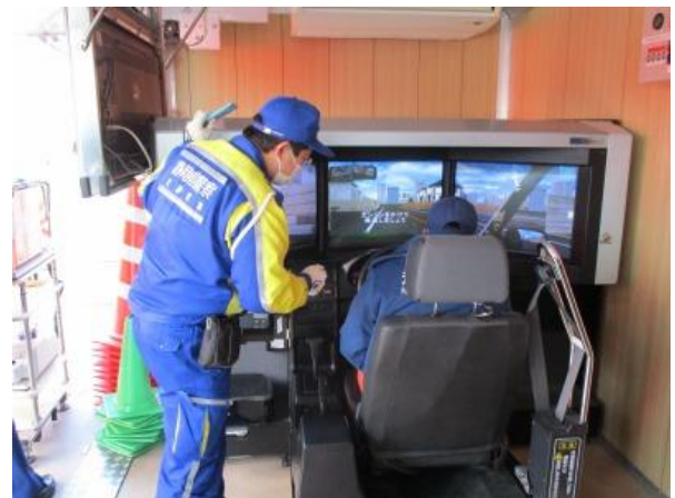
【ドライビングシミュレーター】