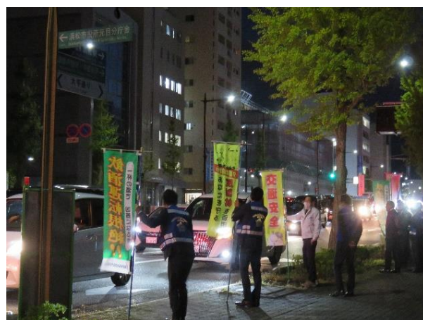
【夕暮れ時の交通安全街頭広報活動】