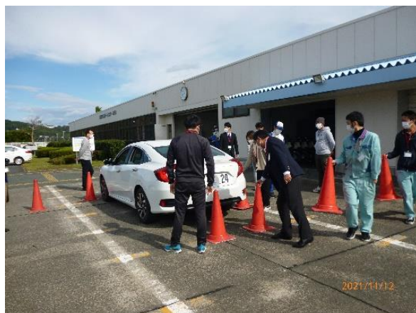
【実技～車両の死角確認】