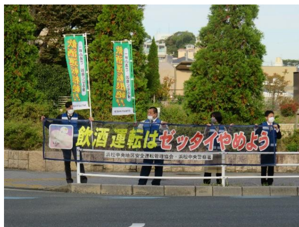
【早朝の交通安全街頭広報活動】