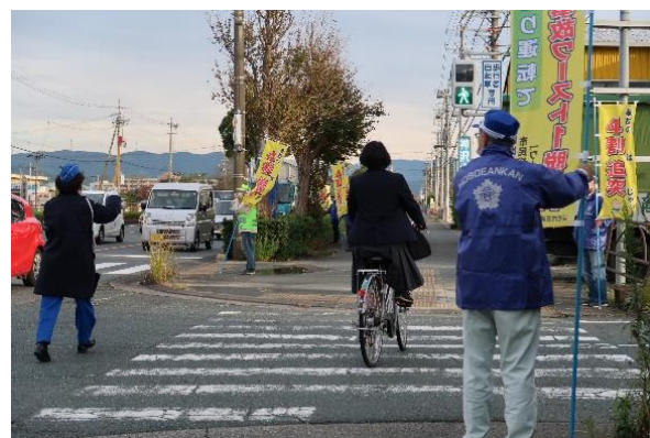
【幟旗を掲出して交通安全街頭広報】