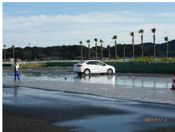
【実技～低ミュー路のブレーキ体験】