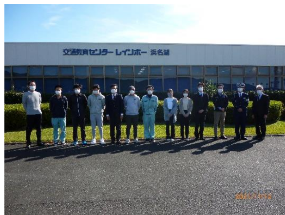
【ドライバー研修会に参加した皆さん】