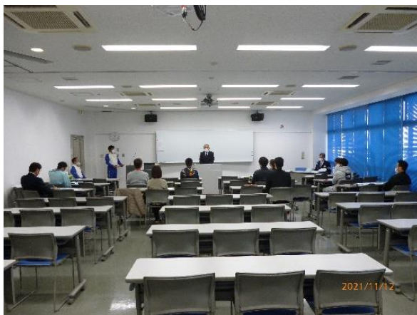
【座学～より安全な運転者になるために】

※参加事業所：「FDK(株)湖西工場」「富士機工(株)新居事業所」「市立湖西病院」「湖西市消防本部」「浜名湖電装(株)吉美工場」「(株)デンソー湖西製作所」「(株)ユニバンス本社工場」