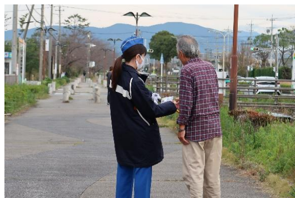
【自転車通勤者や通行人に対して反射材を交付】