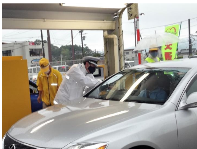
【駐車場利用の運転者に対して飲酒運転根絶を呼び掛け】