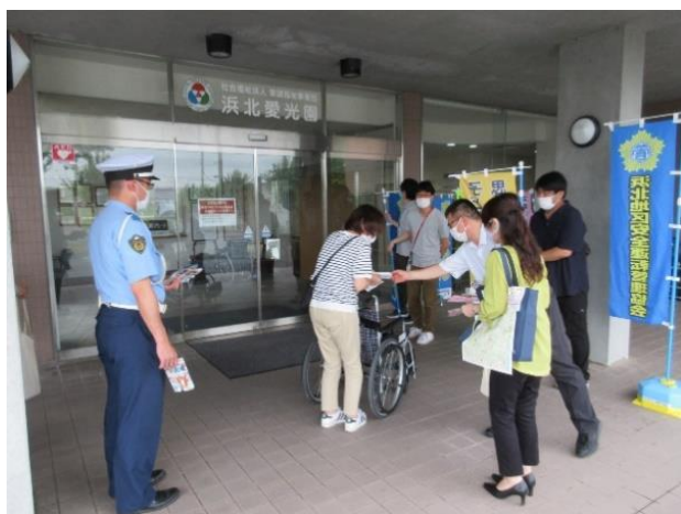
【施設玄関前で帰宅する職員等に対して飲酒運転根絶を呼び掛け】