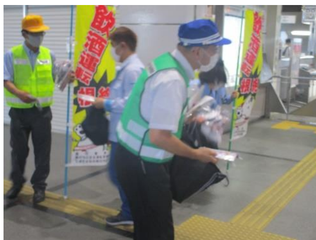
【飲酒運転根絶キャンペーンの活動状況】