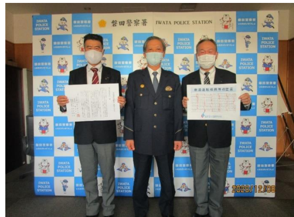
【遠鉄磐田自動車学校から交通安全宣言書を提出】