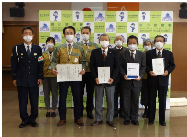
【交通安全宣言書を提出した事業所代表者の皆さん】

提出日 令和2年12月21日（月） 10:30～ 提出場所 掛川警察署 署長室 提出事業所 中部電力パワーグリッド(株)掛川営業所 143名分 NEC プラットフォームズ(株)掛川営業所 1,004名分の「交通安全宣言書」を掛川警察署・川口署長へ提出