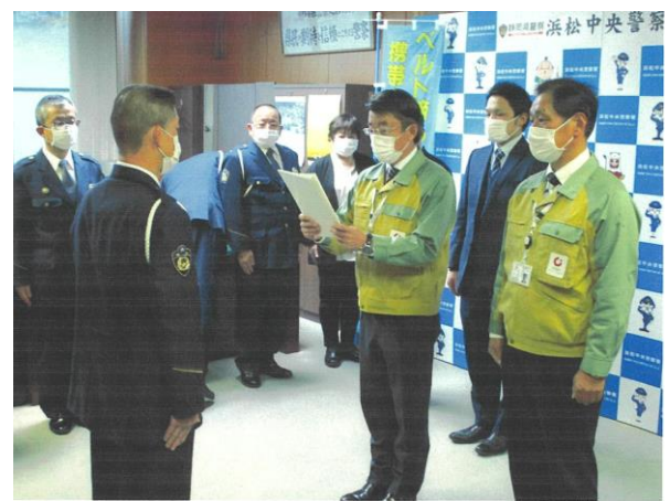
【中部電力パワーグリッド(株)の宣言書提出】