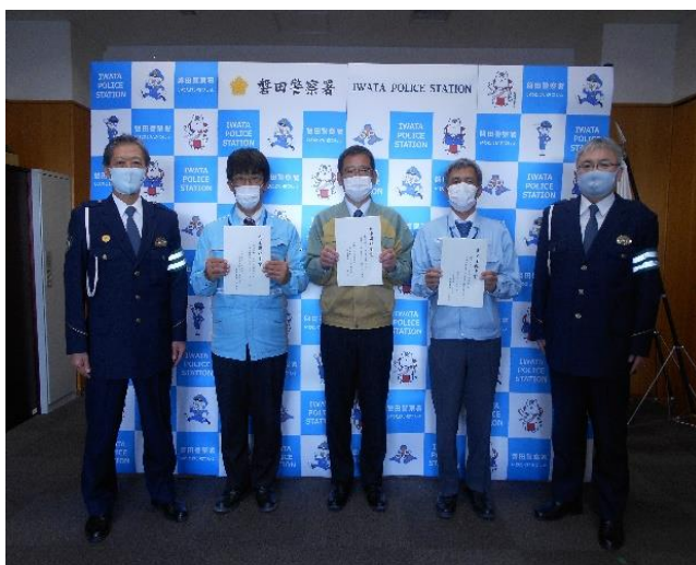
【交通安全宣言書を提出した事業所 代表者の皆さん】