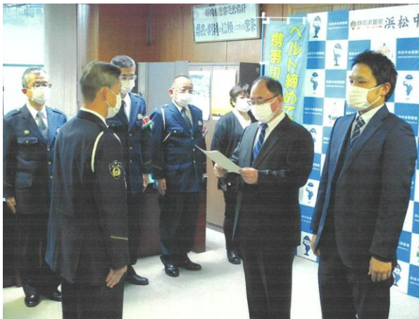
【浜松市社会福祉協議会の宣言書提出】