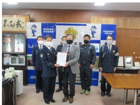
【伊東地区安全運転管理協会会長から伊東警察署長へ交通安全宣言書を提出】