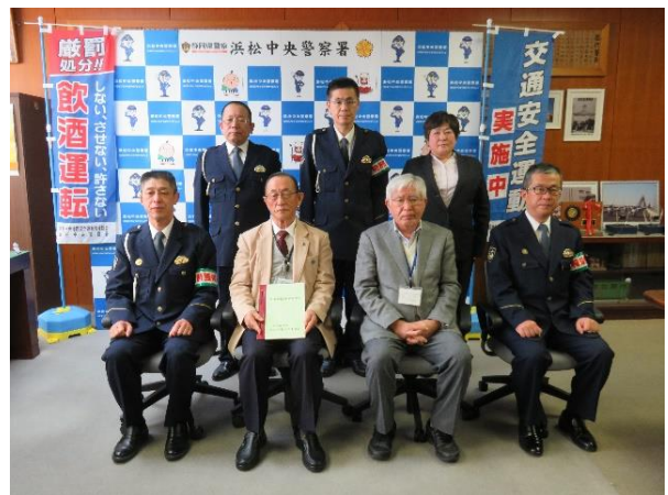
【一般社団法人浜松市食品衛生協会から交通安全宣言書を提出】