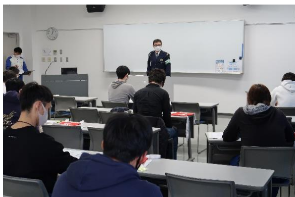
【座学：管内の事故発生状況】