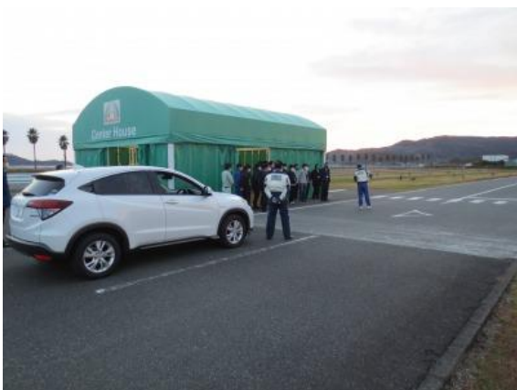
【実技：交差点の交通事故検証】