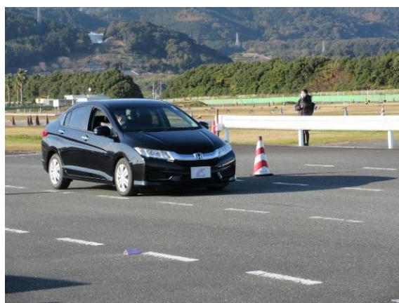
【実技：信号による飛び出しの反応体験】