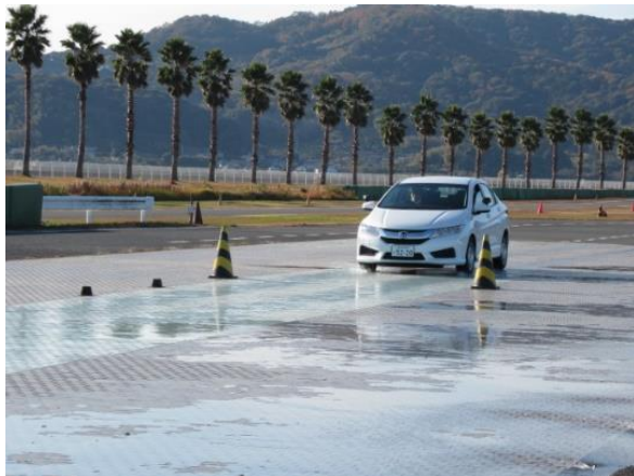
【実技：低ミュー路ブレーキ体験】