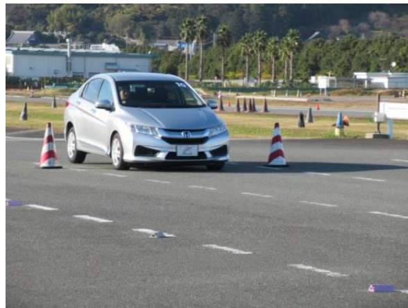
【実技：信号による飛び出しの反応体験】