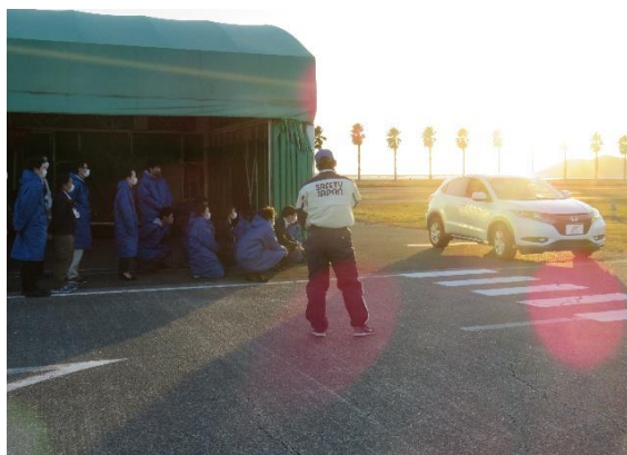
【実技：交差点の事故検証】