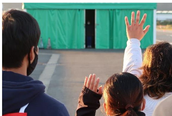
【実技：夜間の視認特性（服装、反射材）】