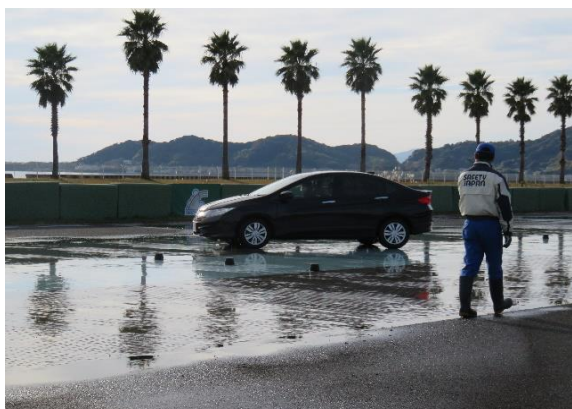
【実技：低ミュー路ブレーキ体験】