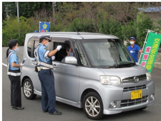
車両通勤の推進事業所従業員に対する交通安全広報活動