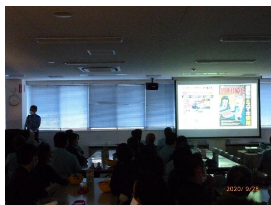
交通安全企業講習会の様子（外国人従業員は社内通訳人が同時通訳）