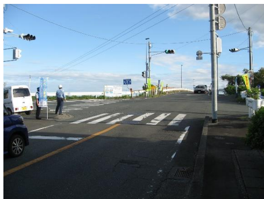
交通関係団体による出会い頭交通事故防止の街頭広報活動